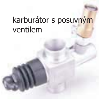
karburátor s posuvným ventilem