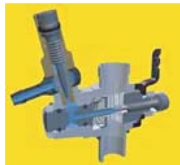
Modře je zobrazen průběh paliva skrz jehlové ventily

Všechny karburátory ovládají rychlost motoru dávkováním vzduchu a paliva, které proudí do motoru. U dvoudobých RC motorů kontroluje tento proces mísení vzduch/palivo, otočný-soudkový nebo kluzný-ventilový karburátor: ventil ovládá množství vzduchu vpuštěného do motoru a palivová jehla nebo jehly ovládají dodávku paliva. Když zatáhnete páčku na vysílače, servo otočí karburátorem ( u otočného) nebo otevře kluzný ventil karburátoru aby dodal více vzduchu do motoru a zvýšil výkon a rychlost. Obráceně, když se ventil zavře, uškrtí se přívod paliva a vzduchu a motor zpomalí.